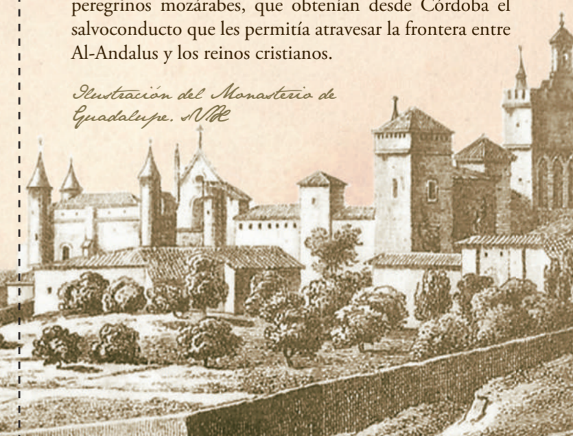
Ilustración del Monasterio de Guadalupe. NBE

Como hemos comentado anteriormente, en nuestra primera etapa del camino se utilizará la antigua calzada romana que unía la zona bética con la lusitana, coincidiendo con el peregrino santiaguista que aprovechaba esta arteria milenaria para dirigirse a Mérida y tomar la Vía de la Plata. Los romanos pavimentaron la calzada y la dotaron de puentes, miliarios (grandes bloques graníticos que indicaban las millas) y mansios (lugares para el descanso de los viajeros, origen de algunas poblaciones actuales). Árabes y cristianos la utilizaron masivamente durante las luchas por las tierras de la meseta, siendo también influyente el uso como ruta de peregrinación a Santiago y a Guadalupe, bajo la denominación de Camino Mozárabe. La bula de Benedicto XII en el siglo XIV así lo ratifica, fue fruto de las preocupaciones del rey Alfonso XI, que deseaba situar en Guadalupe el gran santuario mariano de Castilla para contrarrestar la excesiva preponderancia de Santiago de Compostela como lugar