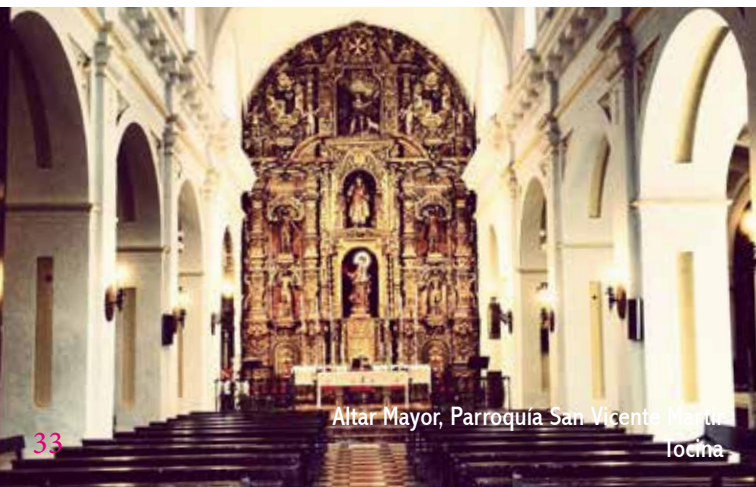
Altar Mayor, Parroquia San Vicente Mártir

Apenas 8 Km separan Tocina de Villanueva del Río y Minas, cruzando el río por la el viaducto de la carretera SE-4001, que tomamos saliendo de Tocina por la calle Emperador Carlos V. Esta vía comarcal concluye en la ermita de San Fernando de El Carbonal, barriada de Villanueva del Río y Minas. La ermita, cerrada y en estado de abandono, forma parte del paisaje minero que caracteriza a esta población.