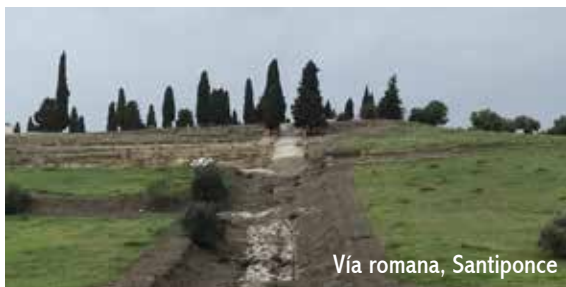
Vía romana, Santiponce