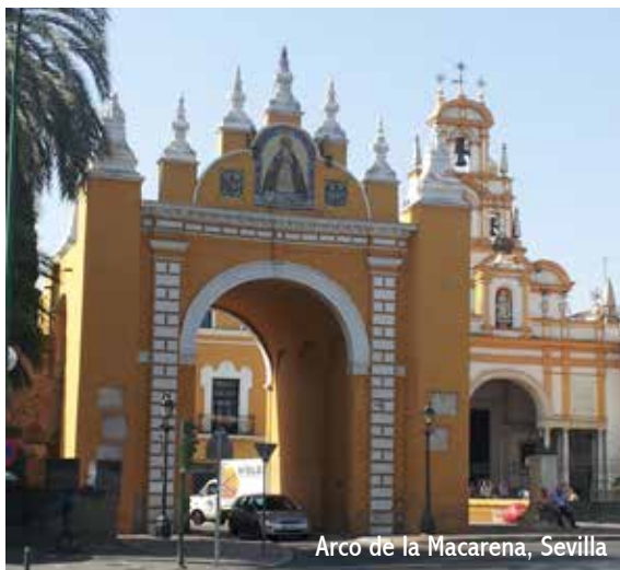
Arco de la Macarena, Sevilla

En su segundo viaje, en 1493, Colón bautizaba a una isla del Caribe con el nombre de Guadalupe. La devoción llegaba a América con los conquistadores. En 1531, la Señora se apareció en Nueva España al chichimeca Juan Diego Cuauhtlatoatzin, identificándose como la siempre Virgen Santa María de Guadalupe. Desde entonces la devoción a esta imagen es el corazón espiritual de la Iglesia en México. Si bien la Virgen de Guadalupe de Extremadura y la de Méjico son muy diferentes, siendo la extremeña una escultura con el Niño en su regazo y la novohispana una manifestación pictórica en su Inmaculada Concepción, numerosos estudios señalan la conexión entre la imagen de Nuestra Señora de la Concepción del coro de la iglesia del santuario extremeño con la patrona de Méjico.