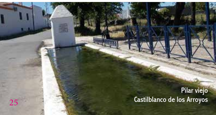
Pilar viejo Castilblanco de los Arroyos

Llegamos a la carretera A-8013 que une Alcalá del Río y Castilblanco de los Arroyos. El camino transcurre en paralelo a la carretera. Pasamos junto al embalse de la Marciega, una zona de alto valor ecológico, y entramos en el municipio por la urbanización La Colina, que bordeamos por un carril al oeste. A la población llegamos por el Ejido de la Fuente Vieja. El Pilar Viejo es un abrevadero de unos 26 m de largo, construido en 1906. Junto al pilar hay un amplio espacio, hoy jardín, que tradicionalmente sirvió para descanso y abrevaje del ganado. Tras descansar, subimos por el callejón de Las dos doncellas a visitar la iglesia parroquial del Divino Salvador. A pie de su torre barroca, un hermoso retablo cerámico nos recuerda la devoción de los castilblanqueños por su patrón San Benito Abad.