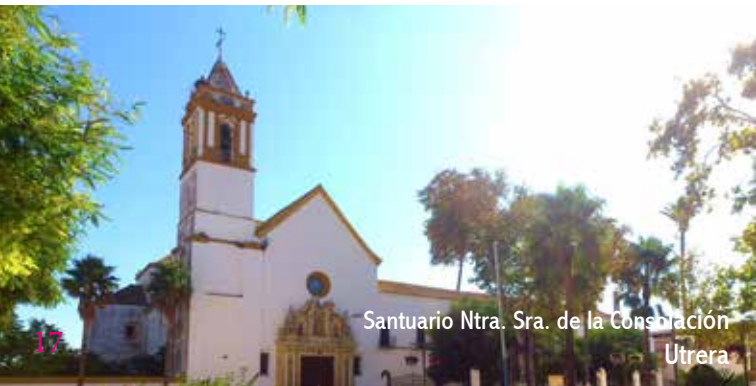
Santuario Ntra. Sra. de la Consolación Utrera

Son numerosas las sorpresas que depara Utrera al visitante, como las iglesias de Santa María de Mesa y Santiago el Mayor, así como el castillo, el Centro Cultural Casa Surga y el propio ayuntamiento emplazado en el palacio de Vistahermosa, del siglo XVIII. Pero no podemos dejar la ciudad sin visitar a su patrona, Ntra. Sra. de la Consolación en su santuario, antiguo convento franciscano que estuvo bajo el patrocinio del valido del rey Felipe IV, el Conde Duque de Olivares. Hay que detenerse a admirar sus numerosos tesoros artísticos, entre los que destaca el retablo barroco del altar mayor.