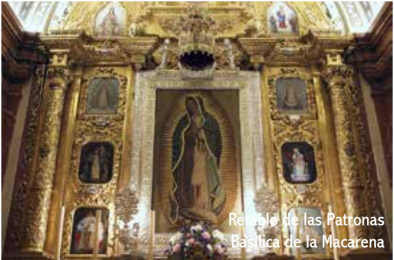
Retablo de las Patronas Basílica de la Macarena

De la especial vinculación con Nueva España, arraiga en Sevilla la devoción novohispana a Santa María de Guadalupe, hecho que coincide con la consolidación de las hermandades de pasión. Es entonces cuando la Hermandad de las Aguas añade su adscripción a María Santísima de Guadalupe en su título. También Macarena, Montserrat, La O, El Baratillo, Sagrada Mortaja, San Benito, Soledad de San Buenaventura, Pasión y Cerro del Águila patentizan la especial devoción de los sevillanos por Santa María de Guadalupe.