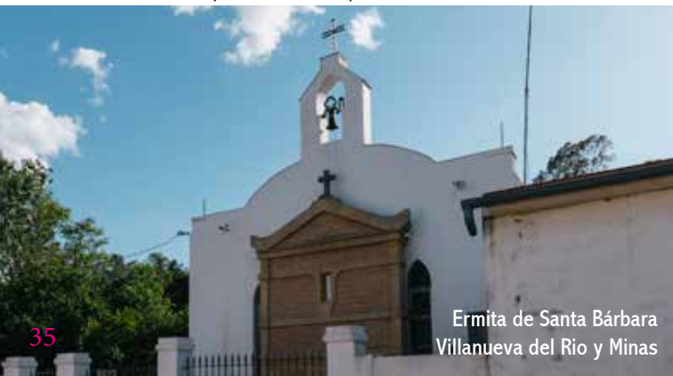
Ermita de Santa Bárbara Villanueva del Río y Minas

A 8 Km está el desvío a las ruinas de la ciudad romana de Munigua, de origen turdetano e igualmente relacionada con la historia y tradición minera de Sierra Morena. El consejo es llegar al enclave con tiempo para poder disfrutarlo detenidamente. El camino en su último tramo discurre paralelo a la vía del ferrocarril hasta El Pedroso, localidad a la que accedemos por la A-432.