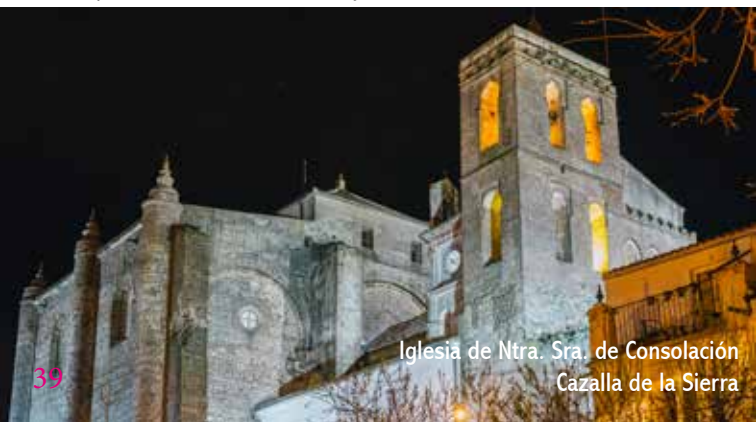
Iglesia de Ntra. Sra. de Consolación Cazalla de la Sierra

La capilla de los peregrinos es un reputado establecimiento hotelero que mereció mención de honor del Premio Europa Nostra en 1987. Bordeando Los Chozos de Cazalla, una villa turística, seguimos por una dehesa de frondoso bosque que se aclara conforme nos acercamos al arroyo de Castillejo, que cruzamos en dirección este a la vereda de la Dehesilla, que pasa bajo la vía del ferrocarril. Seguimos hacia el norte hasta enlazar con la A-432, que recorreremos 3 Km para desviarnos a la derecha por Siete Caminos, a la ermita de Ntra. Sra. de las Angustias, patrona de Alanís. A la población accedemos por el sur, por la ermita de San Juan y el castillo.