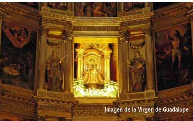
Imagen de la Virgen de Guadalupe

En su segundo viaje, en 1493, Colón bautizaba a una isla del Caribe con el nombre de Guadalupe. La devoción llegaba a América con los conquistadores. En 1531, la Señora se apareció en Nueva España al chichimeca Juan Diego Cuauhtlatoatzin, identificándose como la siempre Virgen Santa María de Guadalupe. Desde entonces la devoción a esta imagen es el corazón espiritual de la Iglesia en México. Si bien la Virgen de Guadalupe de Extremadura y la de Méjico son muy diferentes, siendo la extremeña una escultura con el Niño en su regazo y la novohispana una manifestación pictórica en su Inmaculada Concepción, numerosos estudios señalan la conexión entre la imagen de Nuestra Señora de la Concepción del coro de la iglesia del santuario extremeño con la patrona de Méjico.