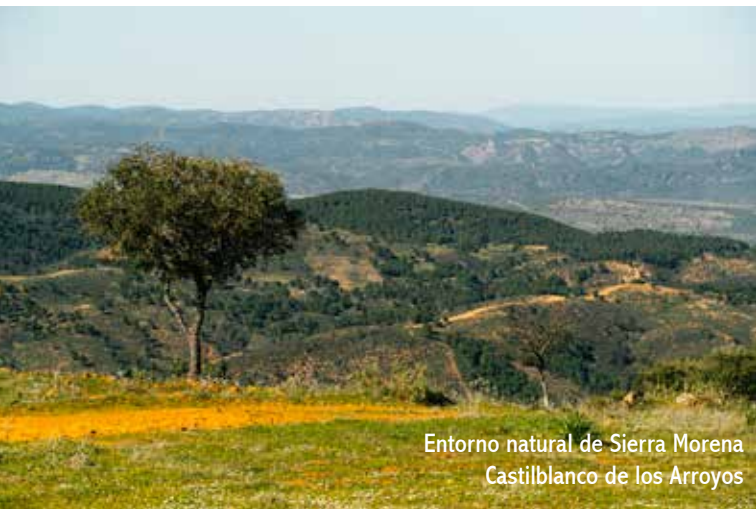
Entorno natural de Sierra Morena Castilblanco de los Arroyos

El Camino Real de Sevilla, transcurre por otros pasos naturales de Sierra Morena. Si la corriente del Guadalquivir no permitía cruzarlo en Sevilla, los peregrinos debían remontar el río hasta el primer vado posible. El camino puede variar según los vados y la época del año, para confluir en Alanís. Éste fue el camino que siguió Cristóbal Colón en 1493 y en Guadalupe se bautizaron los primeros nativos americanos llegados a Europa. También fue el camino de muchos españoles que dejaron su tierra para embarcarse a América y el de los que regresaron a dar gracias a la patrona. Por ello, la ruta se denomina “Camino Colombino de Guadalupe”. La Vía Colombina parte de Sevilla por el antiguo monasterio de San Jerónimo de Buenavista, llega a La Rinconada, sigue por Brenes y cruza el Guadalquivir en Villanueva del Río. Sierra Morena se franquea por El Pedroso, Cazalla de la Sierra, Alanís y Guadalcanal.