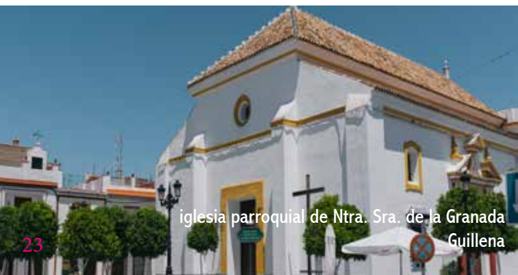
iglesia parroquial de Ntra. Sra. de la Granada Guillena

Bordeando el Teatro Romano nos dirigimos al este hacia el río Rivera de Huelva, pasando por debajo de la autovía de la Plata. Ahí encaminamos una vía de servicio que prácticamente en línea recta nos conduce a Guillena. Hay que cruzar la desembocadura del cauce del arroyo de los Molinos, lo que hace que a esta ruta impracticable en época de lluvias. La alternativa no deja de ser sugerente pues nos lleva a La Algaba, por la carretera A-8079, y después pasa por Torre de la Reina, que es un bonito pueblo de colonización perteneciente al municipio de Guillena. En Guillena, en la calle Real, está la iglesia parroquial de Ntra. Sra. de la Granada, patrona de la localidad.