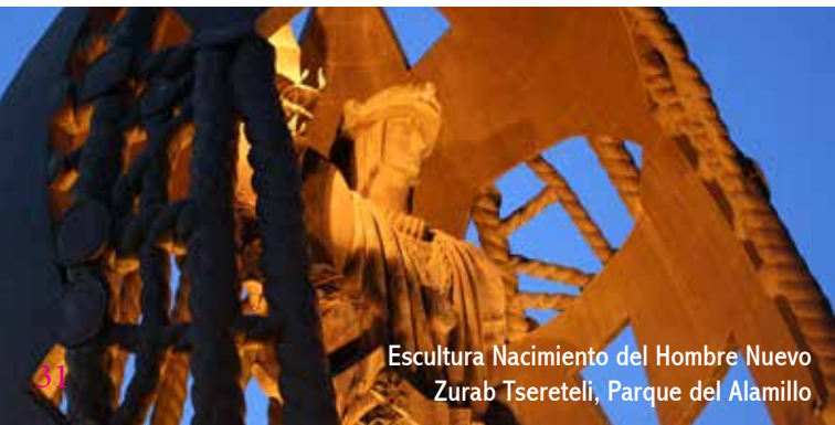
Escultura Nacimiento del Hombre Nuevo Zurab Tsereteli, Parque del Alamillo

Antes de llegar al Nacimiento del Hombre Nuevo, homenaje a Colón regalado por Rusia con motivo de la Expo92, nos desviamos al este por la calle Pez Espada hasta la A-8002 y cruzamos las vías del tren. Inmediatamente a la derecha bajamos unas escaleras al rellano donde se conserva el templete de San Jerónimo, obra gótica del siglo XV. Seguimos la vereda que pasa junto al humilladero hacia el este, hasta Majarabique y de aquí continuamos por el camino paralelo a las vías del tren, primero a San José de La Rinconada y finalmente a Brenes.