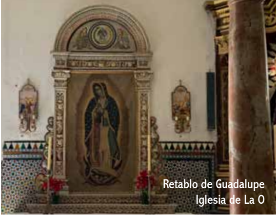
Retablo de Guadalupe Iglesia de La O

Sacramental de San Nicolás y tiene altar propio en Ntra. Sra. de O de Triana. En la provincia, en la iglesia mayor de Santa Cruz de Écija, en la iglesia de San Benito Abad de Gerena y en la iglesia parroquial de San Eustaquio de Sanlúcar la Mayor, todas obras del siglo XVIII. También en Sanlúcar, en el antiguo Convento del Carmen, se venera