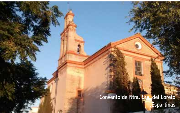
Convento de Ntra. Sra. del Loreto Espartinas

una pintura de reconocido interés, pues se representan con fidelidad los paisajes y monumentos del Cerro de Tapeyac. Otras obras se conservan en el Convento de Ntra. Sra. del Loreto de Espartinas y en el Monasterio de Ntra. Sra. de los Ángeles de Constantina. Queda mencionar que Ntra. Sra. de Guadalupe de Extremadura tiene altar en la iglesia de la Misericordia de Sevilla y que la Virgen novohispana se venera en la iglesia parroquial del Santísimo Corpus Christi, en la avenida de La Palmera, gracias al patrocinio de la comunidad mejicana.